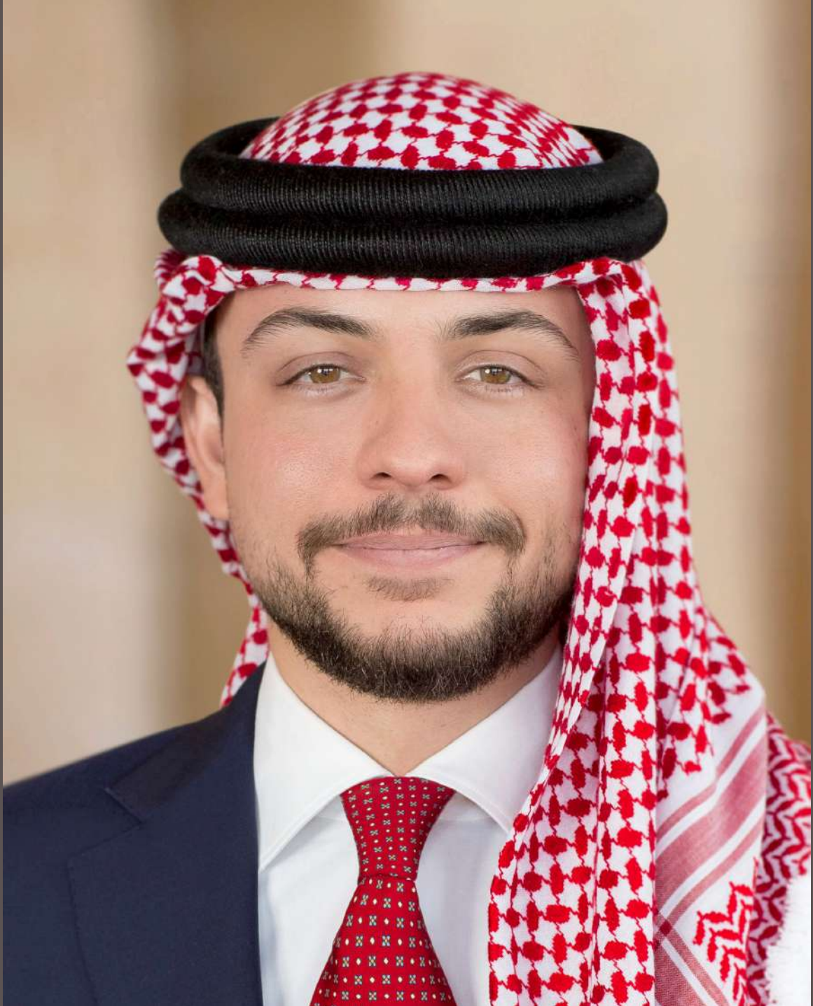
صاحب السمو الملكي ولي العهد الأمير حسين بن عبدالله الثاني